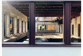
Baustellenimpressionen Kindergarten Thomas-Bornhauser-Strasse 30 September 2019