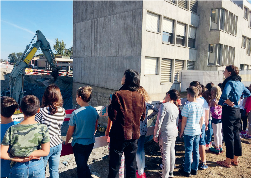
Grundsteinlegung Neubau Stacherholz am 10. September 2018